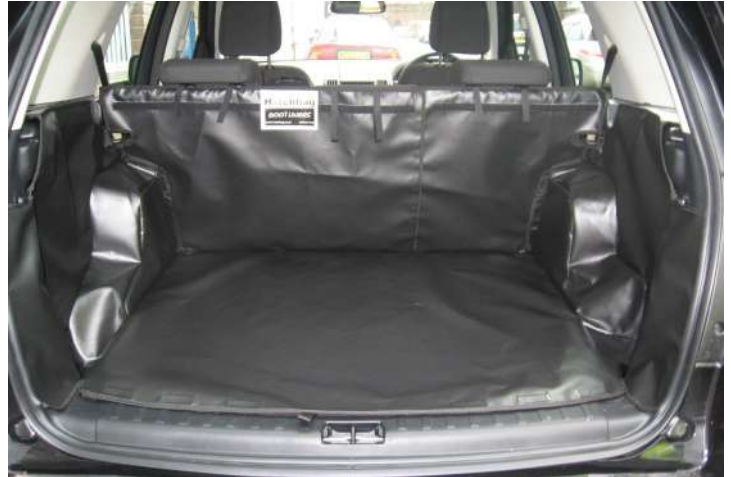
Bild zeigt Kofferraumschutz mit geteiltem Rücksitz, vorbereitet für Rücksitzschoner