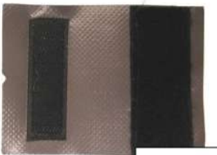
Kombo Haken- und Schlaufenklettband