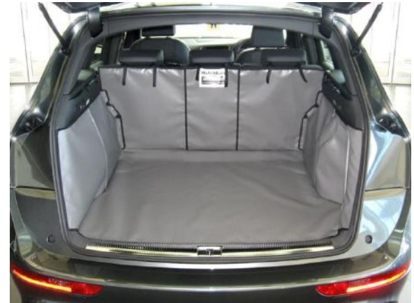
Bild: Geteilter Rücksitz Version