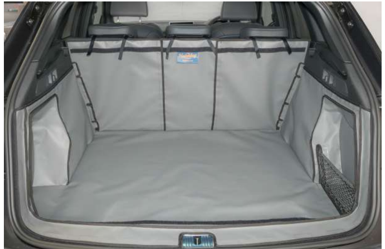
Version "Geteilter Rücksitz" für Variante SH I