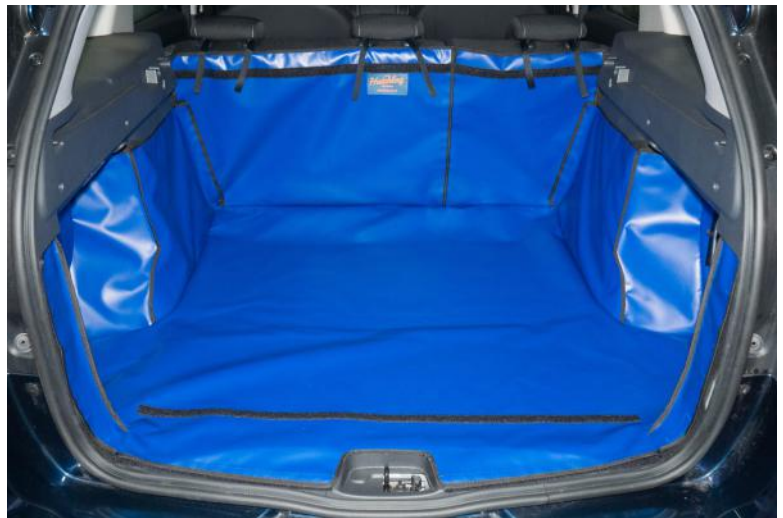
Bild zeigt Kofferraumschutz mit geteilter Rücksitz, vorbereitet für den Stoßstangenschutz und Sitzschoner