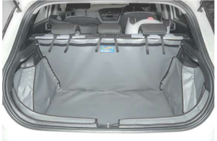
Bild zeigt Kofferraumschutz vorbereitet für den Rücksitzschoner