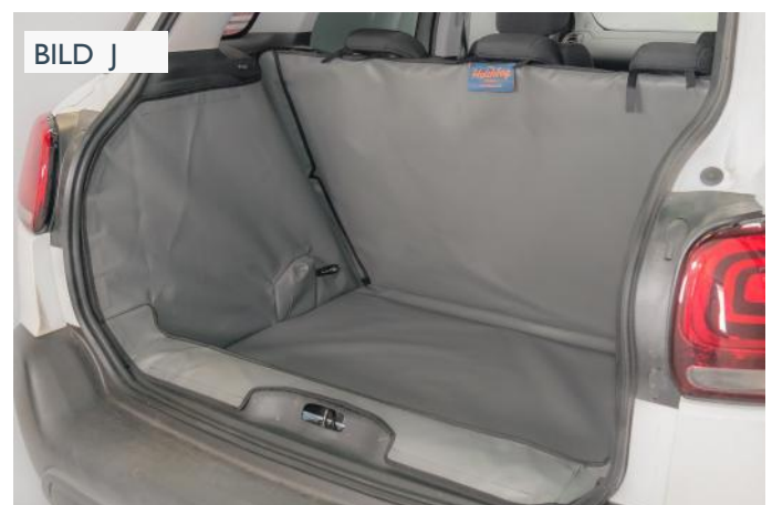
FLOW - NIEDRIGE BODEN