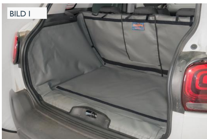
FRSD - ERHÖHTE BODEN