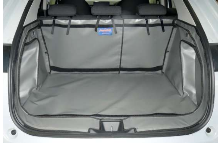
Bild zeigt Kofferraumschutz mit geteiltem Rücksitz, vorbereitet für Stoßstangenschutz, Rücksitzschoner und Verlängerung der Kofferraumauskleidung