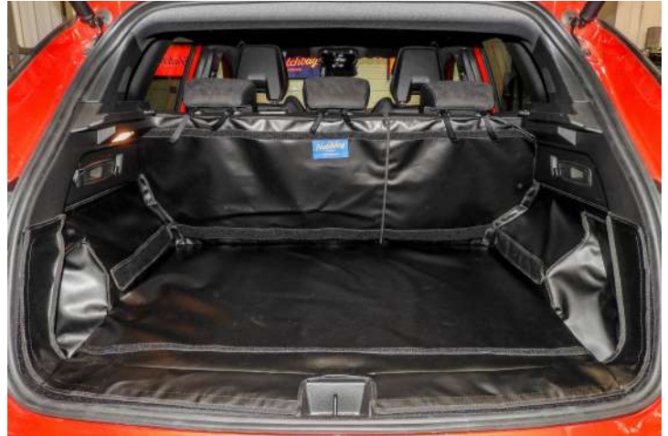
Bild zeigt Kofferraumschutz mit geteiltem Rücksitz, vorbereitet für Stoßstangenschutz, Rücksitzschoner und Verlängerung der Kofferraumauskleidung