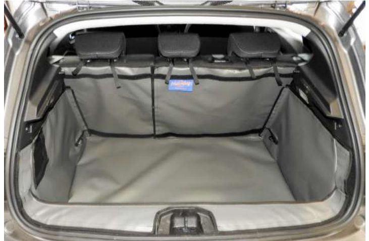
Bild zeigt Kofferraumschutz mit geteiltem Rücksitz, vorbereitet für Stoßstangenschutz, Rücksitzschoner und Verlängerung der Kofferraumauskleidung